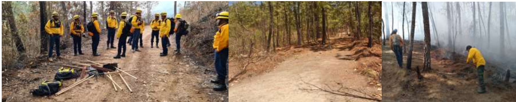
a) Brigada CONAFOR Tecalitlán, coordinada por personal técnico de la JIRCO. b) Brecha cortafuego “El Palmo” c) Quema controlada predio “Agua fría”.

Actividades de prevención realizadas por la brigada CONAFOR-Tecalitlán