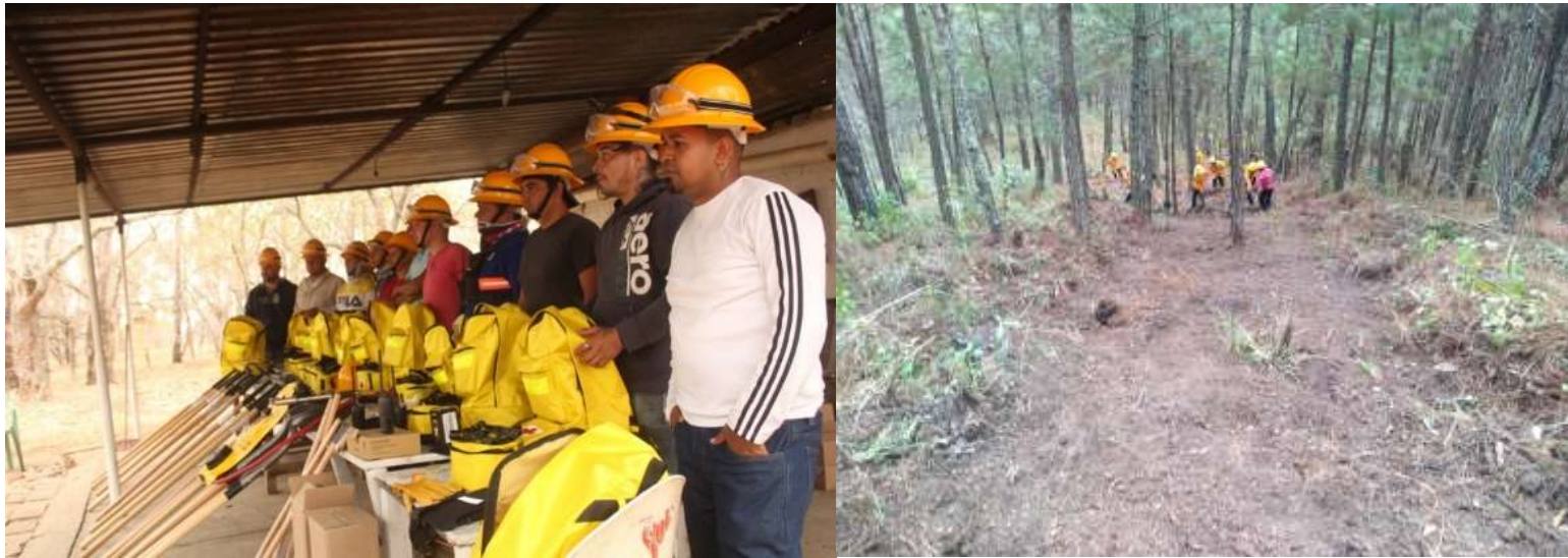
a) Brigada CONAFOR Tamazula, coordinada por el personal técnico de la JIRCO. b) Rehabilitación de brechas cortafuego “Cerrito de la mesa”