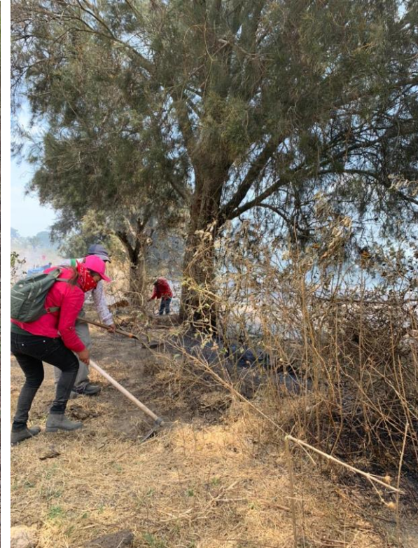
IMAGEN 3 BRIGADA JIRCO-LOS MAZOS, CAMPAMENTO "LA OCOTERA" (IZQ.), COMBATE DE INCENDIO "LOMA ALTA" MPIO. DE TUXPAN