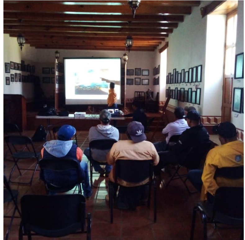
IMAGEN 20 CAPACITACIÓN A BRIGADA JIRCO-CBA Y ELEMENTOS DE PROTECCIÓN CIVIL