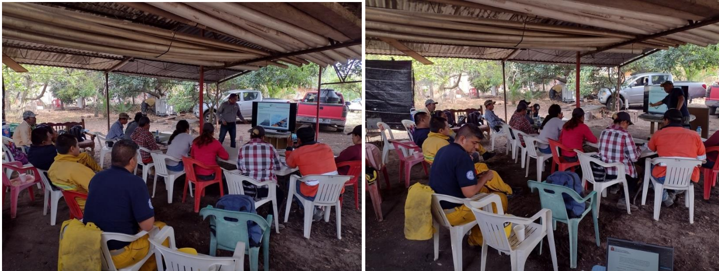
IMAGEN 16 CAPACITACIÓN TÉCNICA A BRIGADA JIRCO-LOS MAZOS Y ELEMENTOS DE PROTECCIÓN CIVIL

Meta: 2 capacitaciones a brigadistas. Se realizaron 3 capacitaciones: la primera en el ejido Los Mazos, mpio. de Tuxpan asistiendo además elementos de Protección Civil del H. Ayuntamiento de Tuxpan; la segunda en las instalaciones del H. Ayuntamiento de Quitupan donde asistieron elementos de Protección Civil de los Municipios de Quitupan y Valle de Juárez, finalmente en Casa de la Cultura del H. Ayuntamiento de Concepción de Buenos Aires, asistiendo también elementos de Protección Civil.