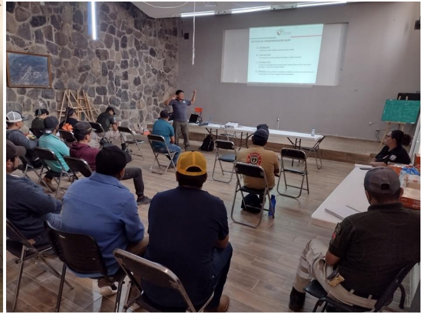
IMAGEN 18 CAPACITACIÓN A BRIGADA JIRCO-QUITUPAN Y ELEMENTOS DE PROTECCIÓN CIVIL