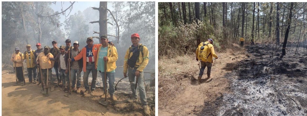
IMAGEN 1 BRIGADA JIRCO-CBA, EXTINCIÓN DE INCEDIO PREDIO "RANCHO CONTENTO" MPIO. DE CBA

1.2.2. Meta: Contratación de brigadas para combate de incendios. Tres brigadas contratadas. Se contrataron tres brigadas, integradas por 11 elementos cada una, siendo éstas: JIRCO-CBA ubicada en el campamento “Cerrito del Valle”, municipio de Concepción de Buenos Aires, JIRCO-Los Mazos ubicada en el campamento “La Ocotera”, municipio de Tuxpan y JIRCO-Quitupan en el campamento “Pino Chino” municipio de Quitupan.