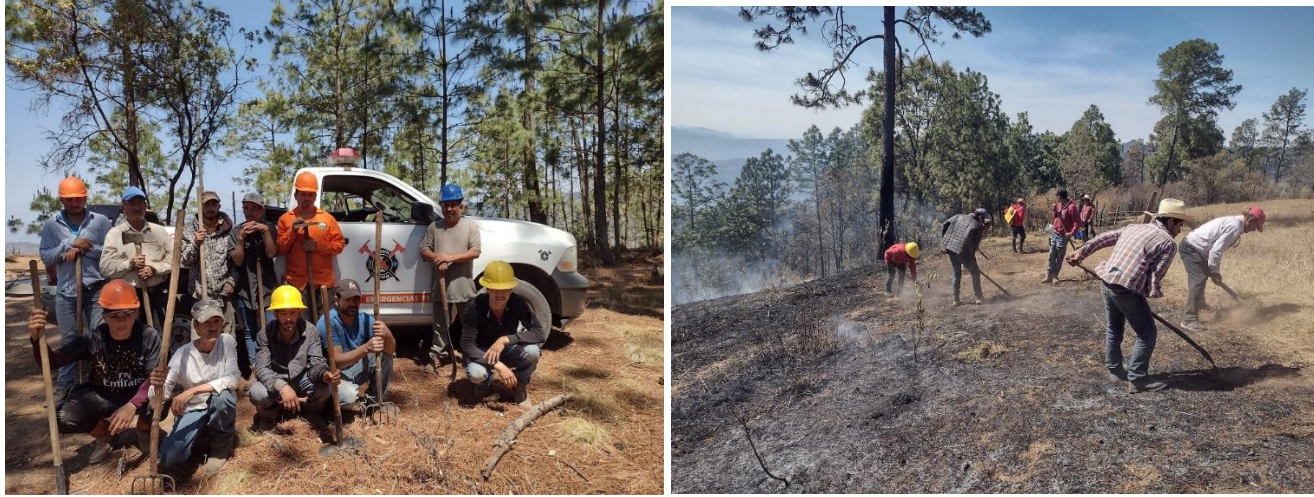
IMAGEN 2 BRIGADA JIRCO-QUITUPAN, CAMPAMENTO "PINO CHINO" (IZQ.) COMBATE INCENDIO EN "PLAN DE CERVANTES" (DER.) MPIO. DE QUITUPAN